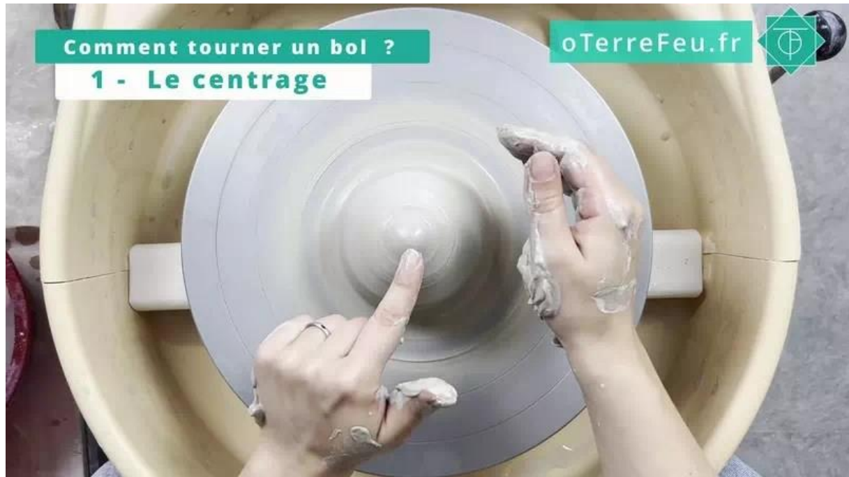
comment tourner un bol poterie – la pièce est centrée

Lorsque la terre est bien centrée, on va faire la boîte à camembert, la base pour commencer à tourner un bol en poterie.