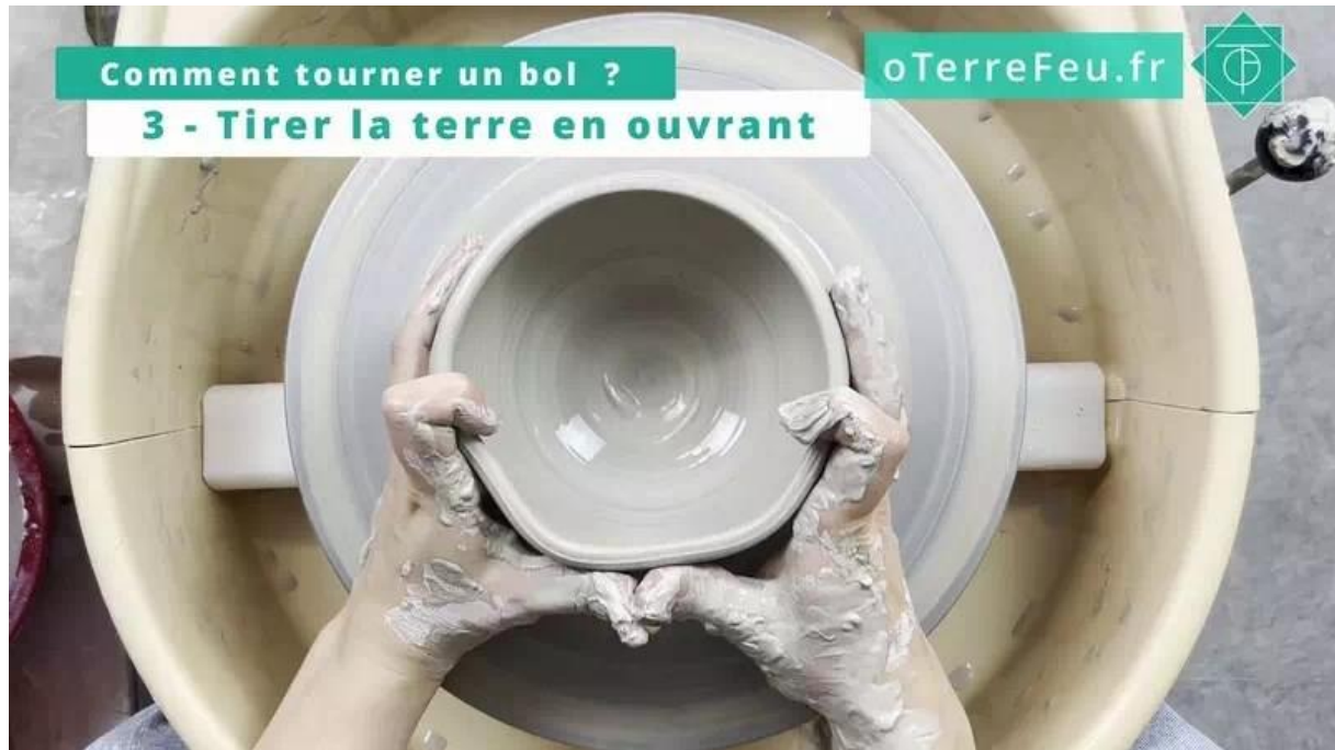
tourner un bol poterie – ajuster la forme du bol