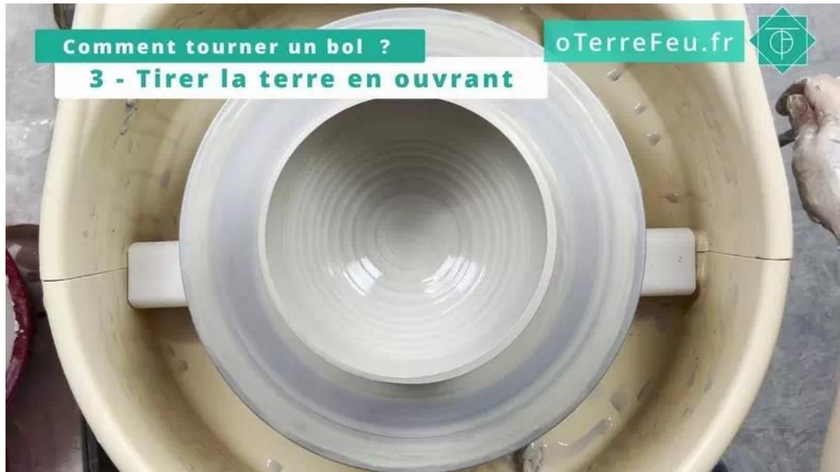
comment tourner un bol poterie – le bol terminé

Affiner les parois pour avoir une forme parfaite.