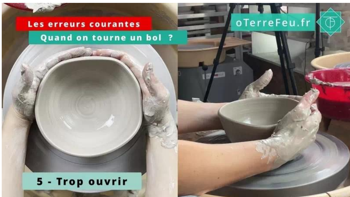
erreur courante quand on tourne un bol – rattraper une trop grande ouverture