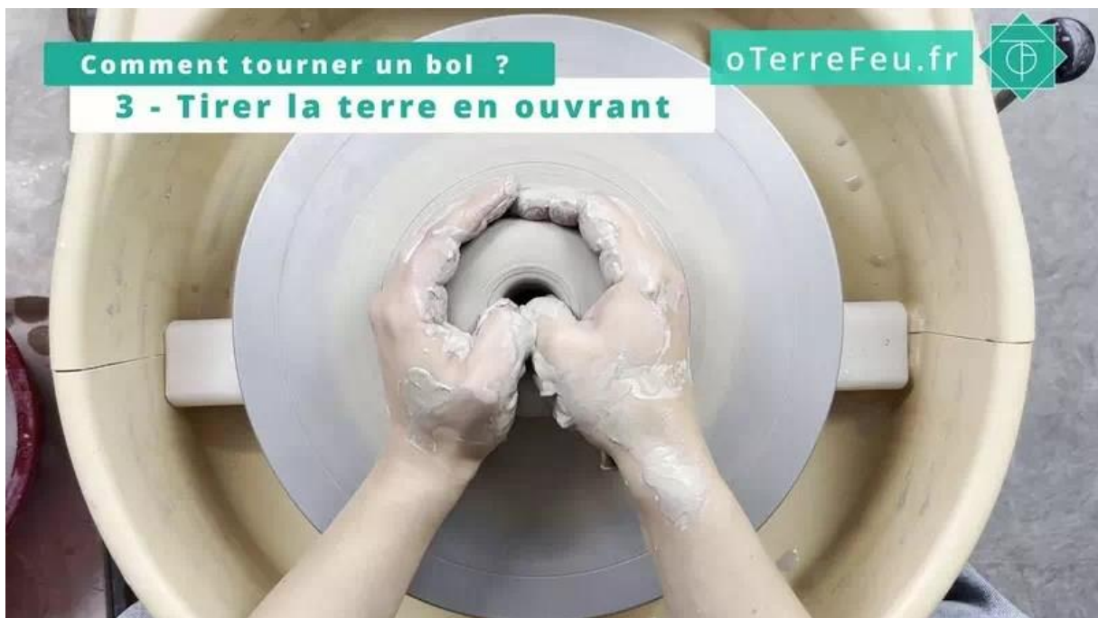
comment tourner un bol poterie – percer le bol

Percez le centre du bol avec votre pouce jusqu'à environ un centimètre du fond. Ouvrez ensuite le fond en tirant la terre.