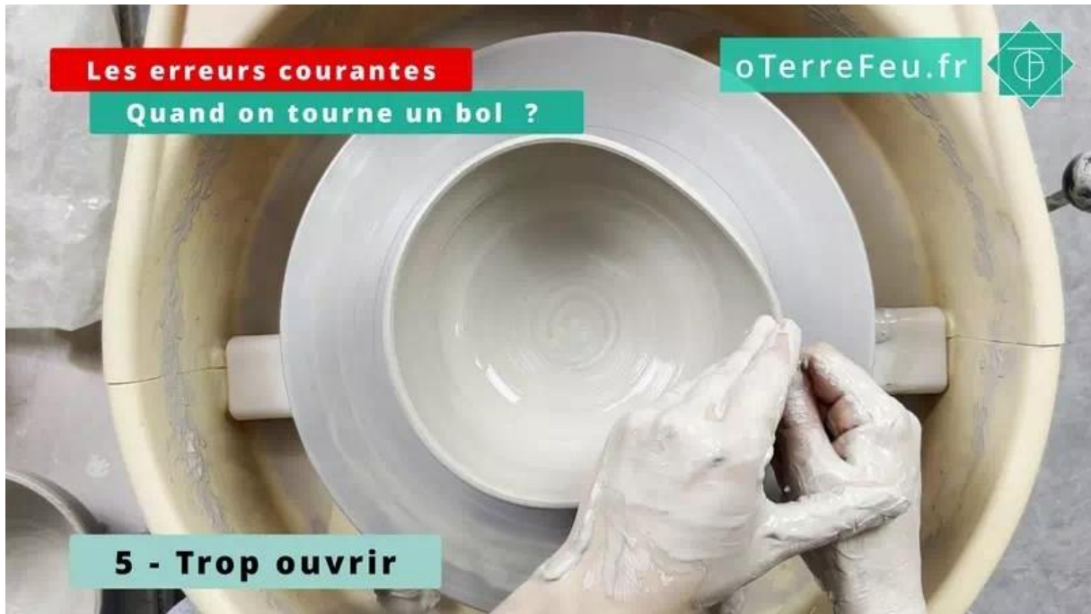
erreur courante quand on tourne un bol – trop ouvrir