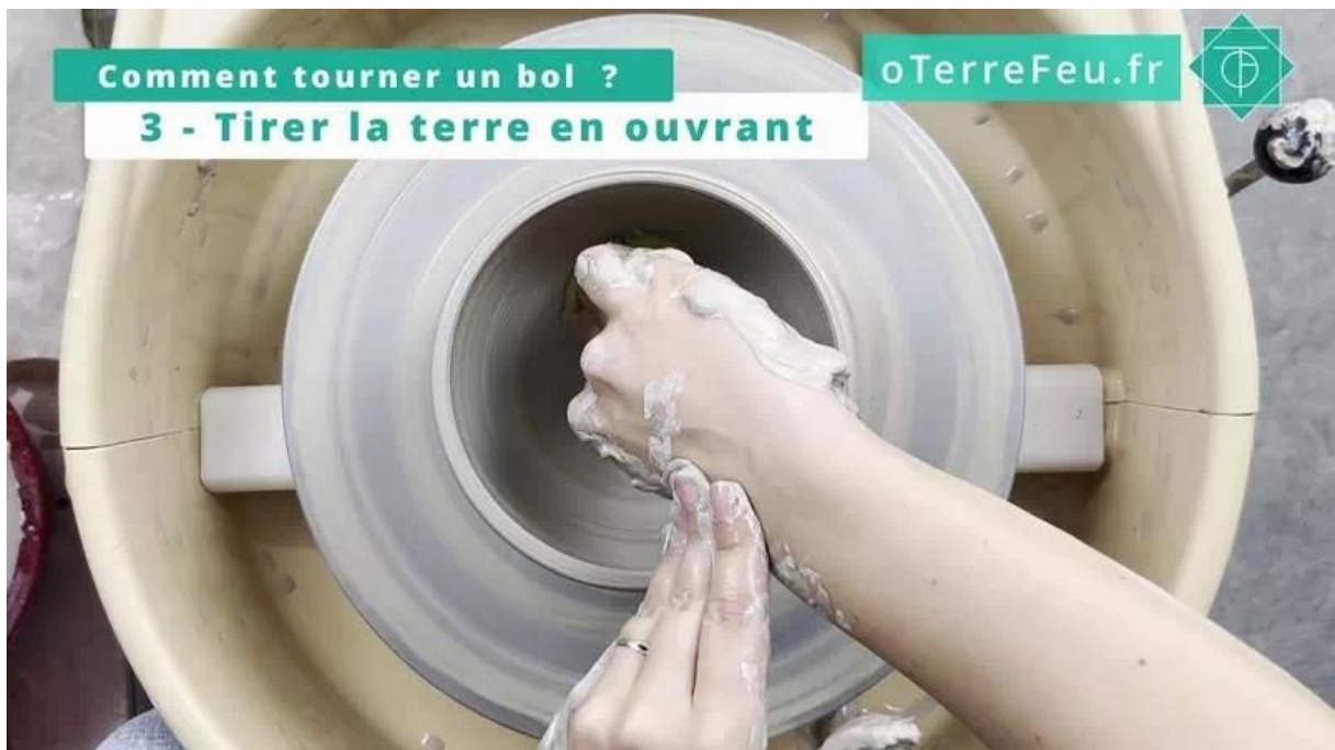
comment tourner un bol – éliminer les irrégularités avec une éponge

Si vous remarquez des irrégularités à l'intérieur, vous pouvez les lisser avec une éponge.