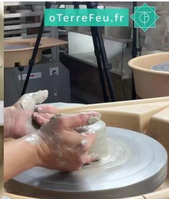
comment tourner un bol poterie – la boîte à camembert