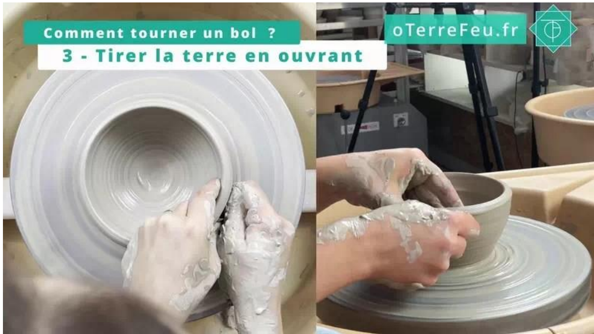
tournage bol poterie – répéter l'opération

Ajustez la forme extérieure du bol en corrigeant et faites attention à la vitesse de la girelle.