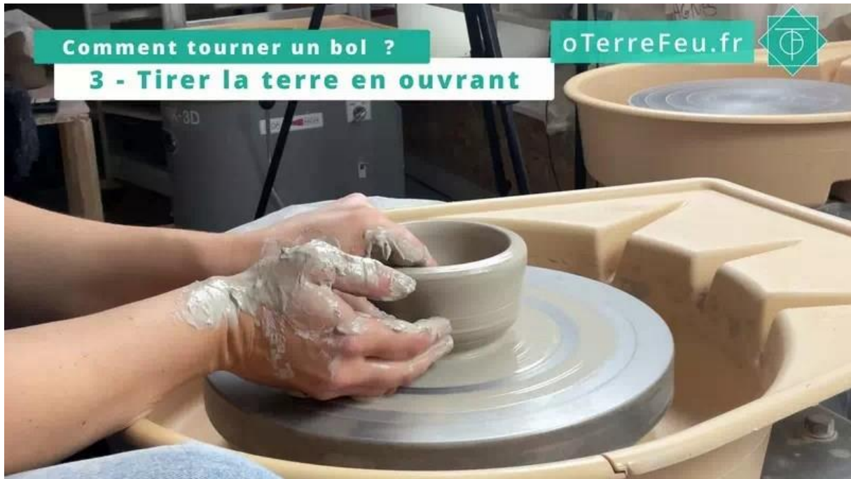
comment tourner un bol – tirer les parois

Pour tirer les parois, positionnez vos mains de manière à pousser la terre vers le haut. Pincez délicatement et tirez lentement pour monter la terre en gardant une forme arrondie. Répétez l'opération jusqu'à obtenir la hauteur et le galbe souhaités.