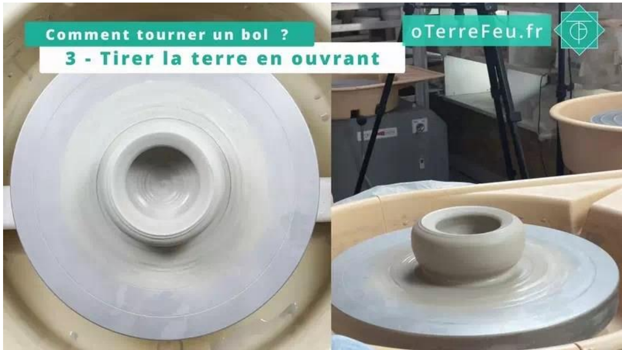
comment tourner un bol – ouvrir le bol