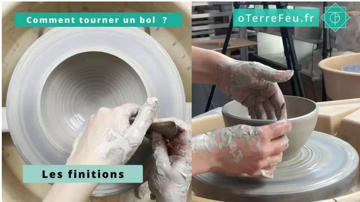
tournage bol poterie – les finitions avec l'estèque

Une fois satisfait de la forme, retirez l'excédent de terre à la base du bol. Cela facilitera évitera du travail en plus lors du tournassage.