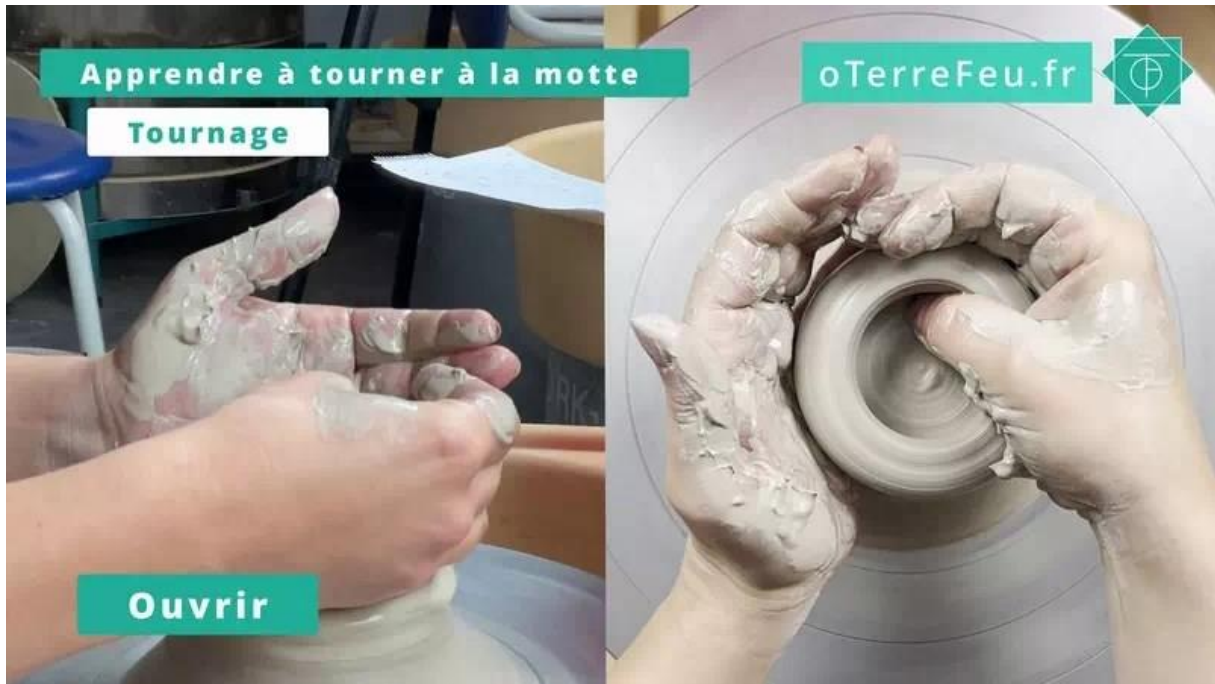
Tournage à la motte – ouvrir

Ensuite, je ralentis le tour et je commence à former les parois. Cette étape est similaire à celle de tourner une pièce classique, mais en miniature. Travailler à petite échelle est un vrai défi, car tout est plus précis. On utilise le bout des doigts, lentement et délicatement. [00:02:22]