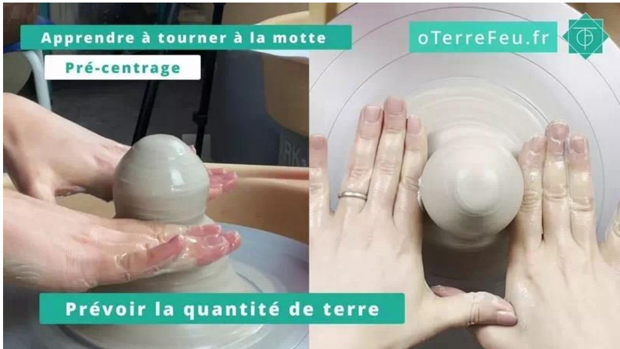
Tournage à la motte – Prévoir la quantité de terre

Centrer une petite portion de terre [00:01:12]