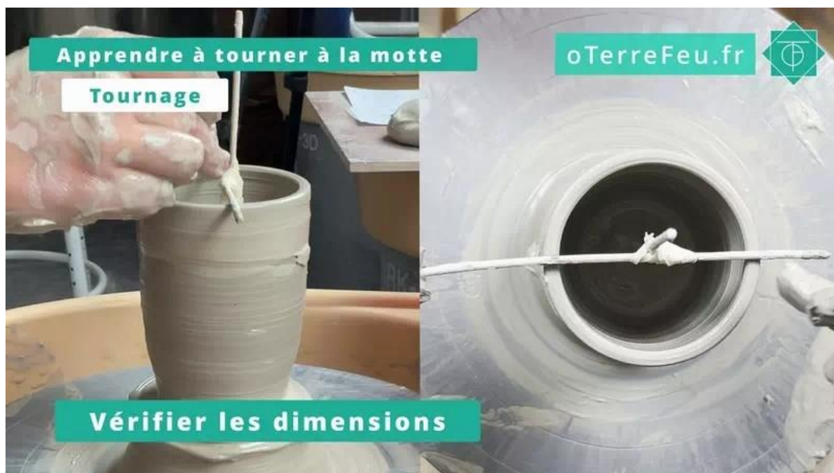
Tournage à la motte – l'outils de fabrication maison