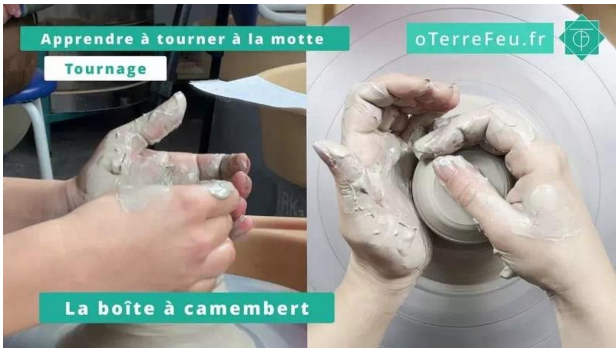
Tournage à la motte – former la boîte à camembert