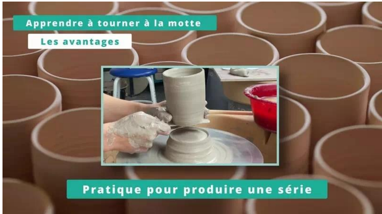
Tournage à la motte – Les avantages