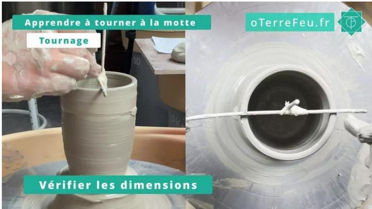
Tournage à la motte – vérifier les dimensions

Une fois que les dimensions me conviennent, je travaille la ligne de la tasse en utilisant une abaisse-langue. Mais vous pouvez également utiliser une estèque pour cette étape. Cela permet d'affiner la forme et d'obtenir des finitions nettes. [00:03:29]