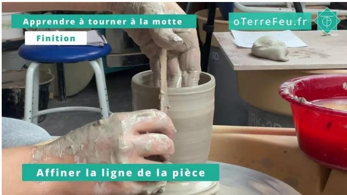
Tournage à la motte – finition

Découper et détacher la tasse [00:03:46]