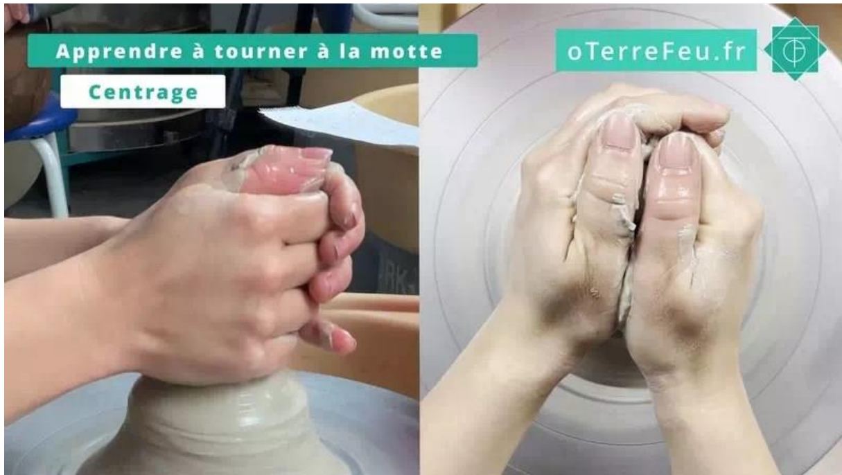
Tournage à la motte – centrer