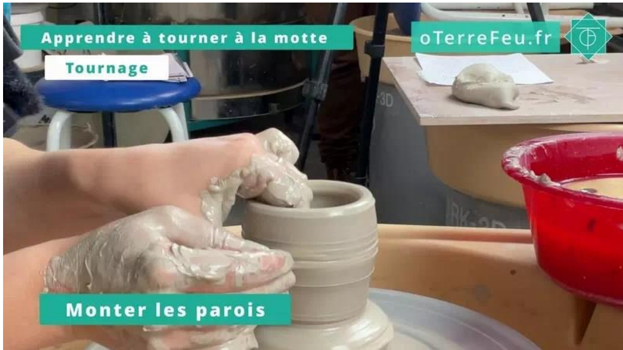
Tournage à la motte – monter les parois

Ajuster les dimensions et monter les parois [00:02:55]